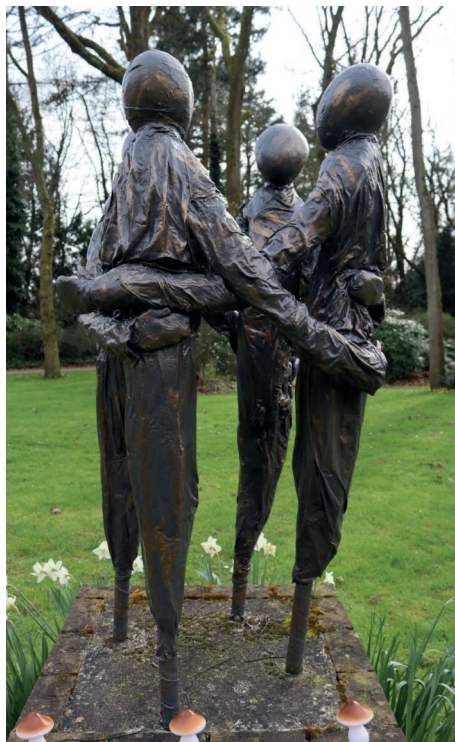
Verbinding – Beeld in de tuin van Johanneshove.