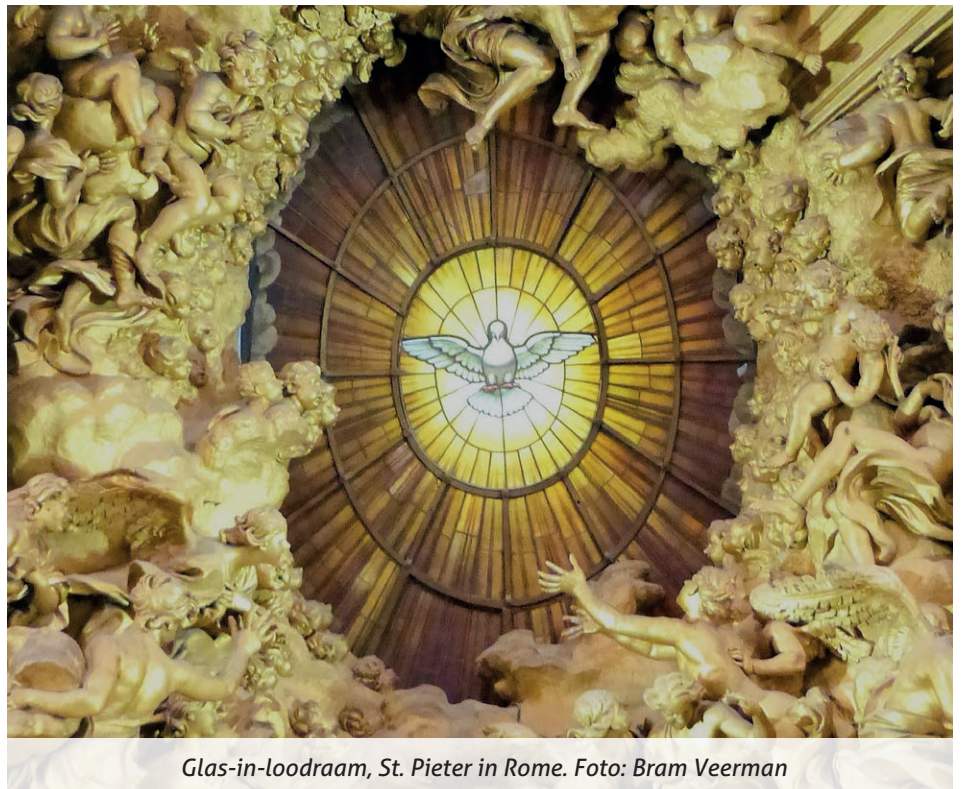
Glas-in-loodraam, St. Pieter in Rome.