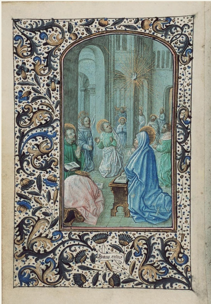
Den Haag, Koninklijke Bibliotheek, MS MMW 10F1, fol.022v Getijdenboek gemaakt te Brugge, ca. 1490

De uitstorting van de Heilige Geest vindt hier plaats in een middeleeuwse kathedraal. In Handelingen 2 lezen we niet wie daarbij aanwezig waren; er staat slechts: Toen de dag van het Pinksterfeest aanbrak waren ze allen bij elkaar. Maar in de middeleeuwen was het heel gewoon Maria samen met de apostelen af te beelden. Zo ook hier. Maria neemt in haar koningsblauwe mantel (zij is immers Koningin van de Hemel – regina caeli ) de prominente plaats in. Verder zien we op de voorgrond links Johannes en Petrus. Johannes ligt in zijn lichtroze mantel voorover gebogen op zijn knieën. Aan die houding kunnen wij hem herkennen, zo is hij altijd te zien in afbeeldingen van het Laatste Avondmaal, waar hij met zijn hoofd ligt in de schoot van Jezus. Petrus heeft een boek in zijn hand en kijkt omhoog naar de duif die komt aanvliegen terwijl er lichtstralen op de apostelen neerdalen.