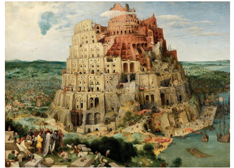
Pieter Bruegel de Oude

Pinksteren is een wonder van verstaanbare taal. Wij begrijpen elkaar zo gauw verkeerd. Ook al gebruiken wij dezelfde woorden, dan nog is er geen enkele garantie dat we ons bewust zijn van wat de ander precies bedoelt.