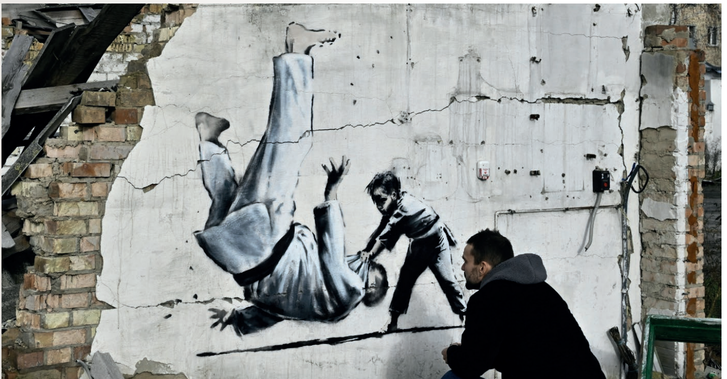
Banksy, Street-art in Oekraïne