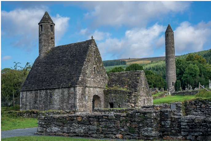
Klooster in Glendalough, Ierland

Typerend is dat het sacrale en het alledaagse nauwelijks gescheiden waren. Het Keltische geloof was een openbaringsgeloof en met veel geduld en ambachtelijke gave werden Bijbels overgeschreven en hoge kruisen in natuursteen gehouwen. Naast de openbaring was er ook veel ruimte voor de natuur en eigen ervaringen van mensen. Jezus werd vereerd als beeldrager Gods, maar de theologie rondom zijn offer was niet een juridisch